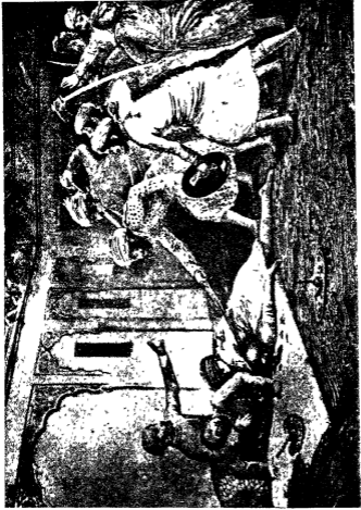
पेशवा नागयन्त्राव की हत्या [ चित्रकार—म० व० धुन्धर ]